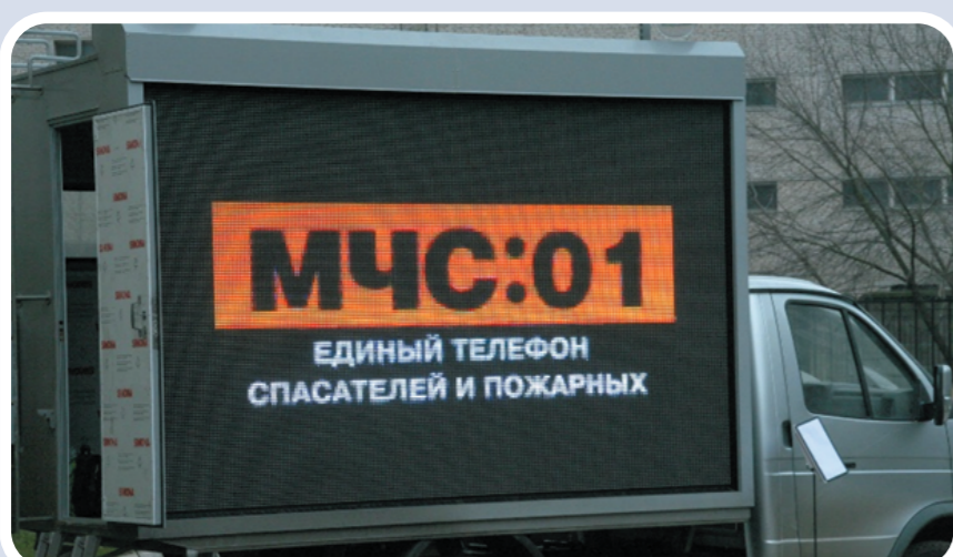
Мобильный комплекс информирования и оповещения населения