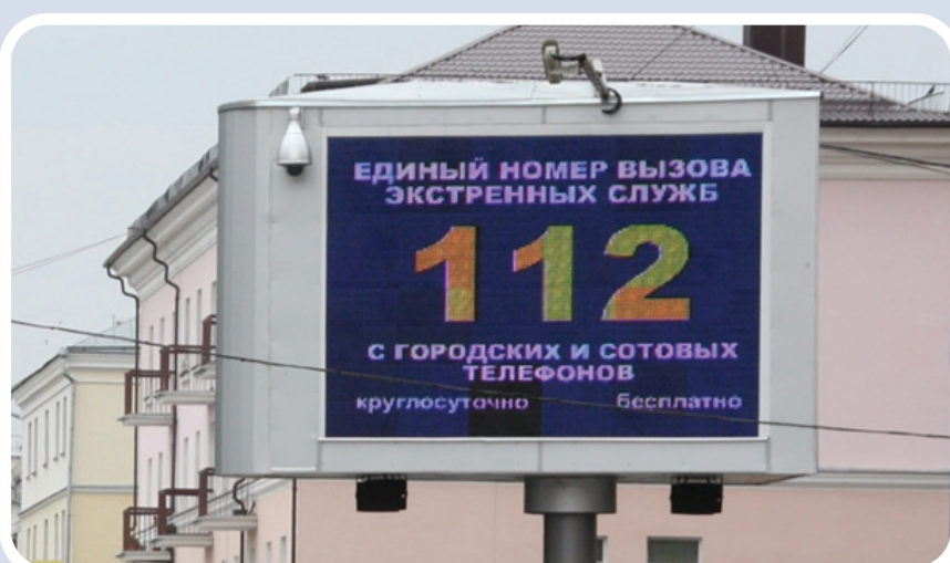
Пункт уличного информирования и оповещения населения