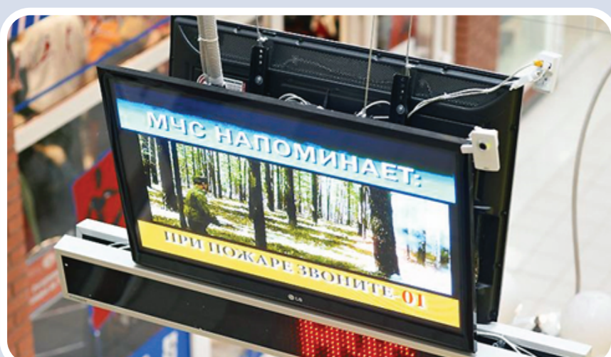
Пункт информирования и оповещения населения в зданиях с массовым пребыванием людей